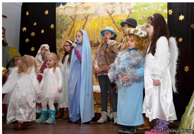
Dzieci są najlepszymi aktorami tradycyjnych „Jasełek” w Rydzewie