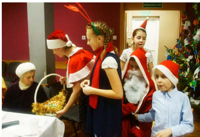
W niezwykle sympatycznej, międzypokoleniowej atmosferze upłynęło Spotkanie Oplątkowe w Miłkach