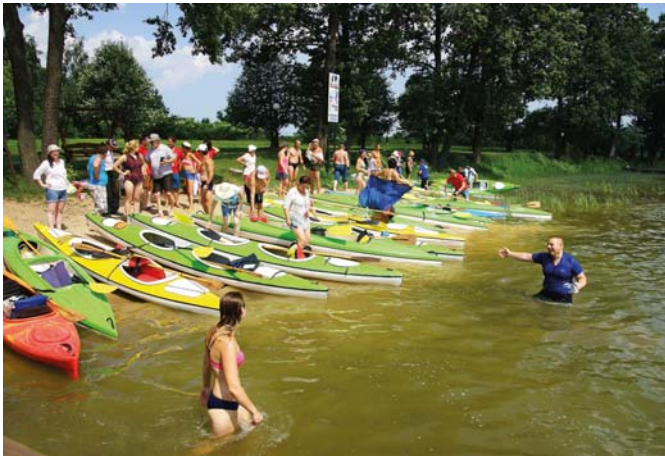
W dużej obsadzie reaktywowany został Kajakowy Splyw Galindów, wiodący jeziorami Ublik Wielki, Buwełno i Wojnowo