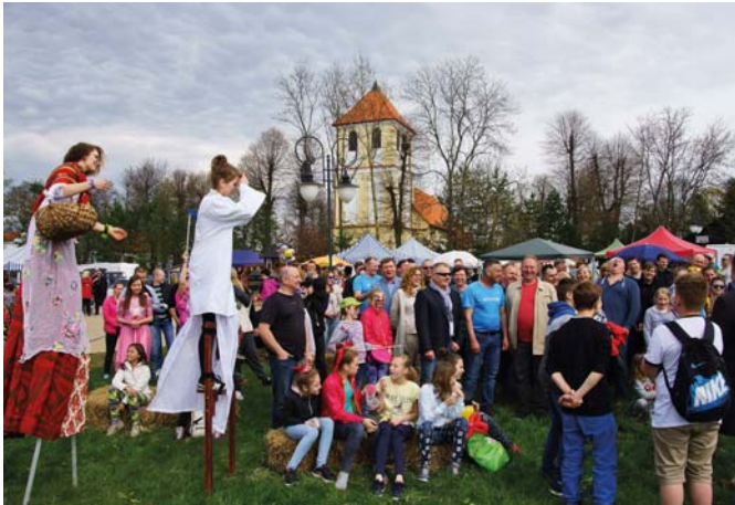
Dzielne, mazurskie rumaki, kłacze oraz źrebaczki znowu gromko zarząły podczas „Rydzewskiej Majówki 2016”