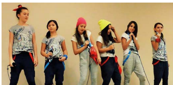
Podczas finału „Śpiewadła” w Giżycku dziewczynki z UNISONO były bezkonkurencyjne