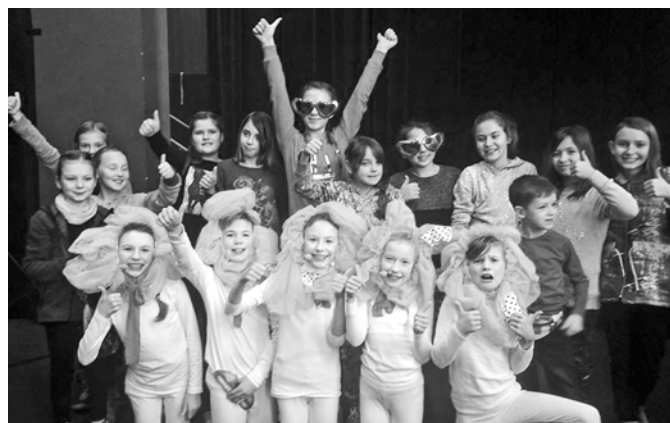
Dzieci z Miłek na pamiątkowej fotce z dziecięcymi aktorami z Teatru Komedii „Valdall”

2 grudnia grupa 12 dzieci z gminy Miłki wybrała się do Gdyni na spektakl teatralny. Wycieczka ta została zorganizowana przez Ośrodek Kultury w Miłkach, jako specjalna nagroda dla dzieci, które od dłuższego czasu systematycznie uczęszczają na różnorakie zajęcia w OK i są na nich bardzo aktywne. Dzieciaki obejrzały spektakl „Alicja w krainie Cz.”, zainscenizowany według słynnej książki Lewisa Carolla przez gdyński Teatr Komedii „Valdall”. Wycieczka była udana, a dzieciaki bardzo szczęśliwe. Warto uczęszczać na zajęcia w OK, więc zamieszczamy ich grafik na okres jesienno-zimowy 2016/2017.