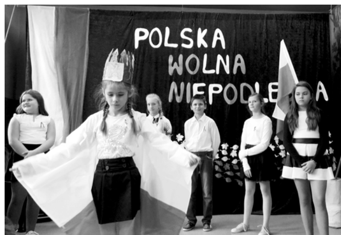
Scena z historycznego montażu artystycznego, przedstawionego podczas akademii