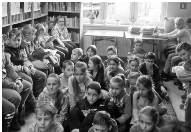
Dzieci ze Staświn wsłuchane w opowieść o twórczości Astrid Lindgren