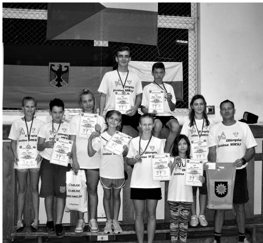
Na Międzynarodowym Turnieju Ringo w Czechach startowały trzy trójki miłkowskich zawodników