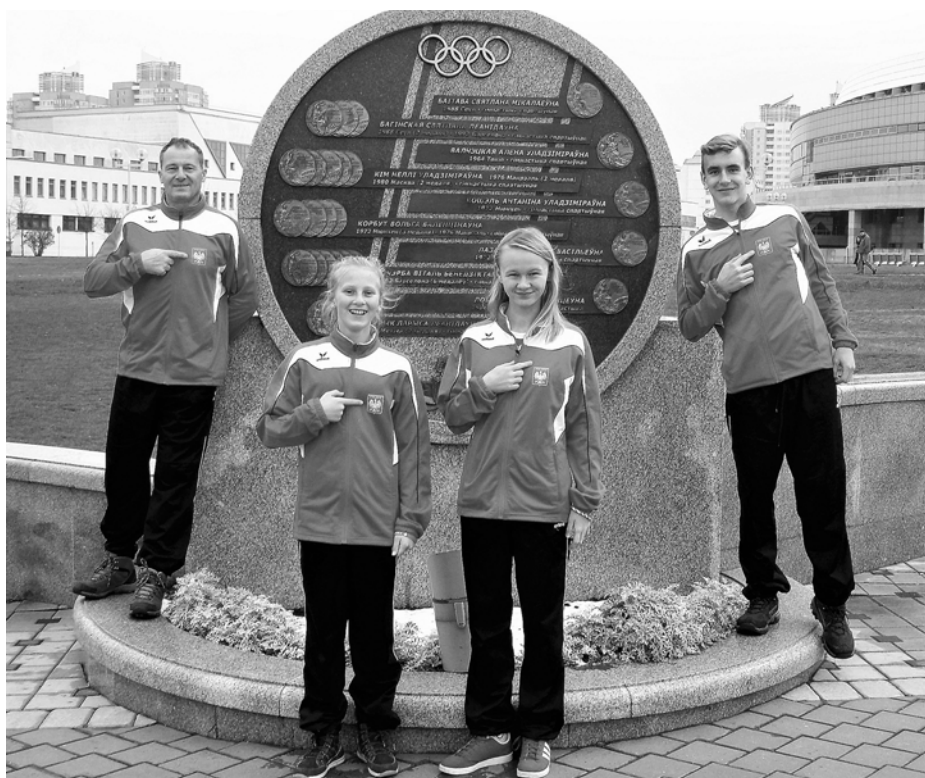
Miłkowska reprezentacja Polski na Międzynarodowym Turnieju Ringo w Mińsku na Białorusi