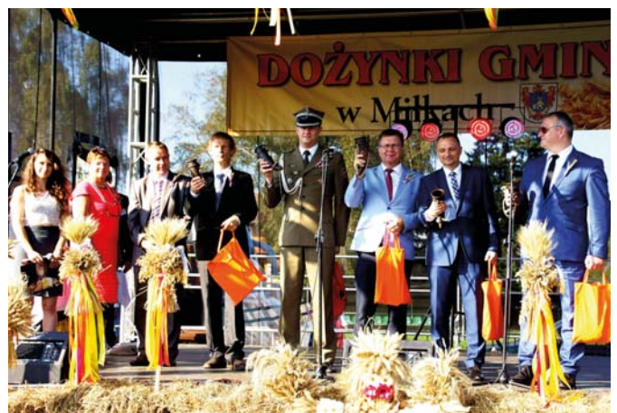
Wrzesień – silna reprezentacja samorządowo-wojskowo-parlamentarna na Dożynkach Gminnych 2016 w Miłkach