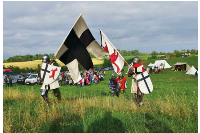
W lipcu odbyła się wielka impreza rekonstrukcyjna na Świętej Górze w Staświnach, która ma szansę stać się największą letnią imprezą w gminie