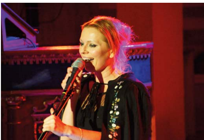
Również w lipcu wspaniały koncert w miłkowskiej świątyni dała znana artystka – Anna Maria Jopek