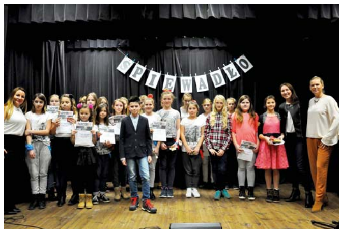
Rodzinne zdjęcie wszystkich uczestników gminnych eliminacji „Śpiewadła 2016” w Miłkach