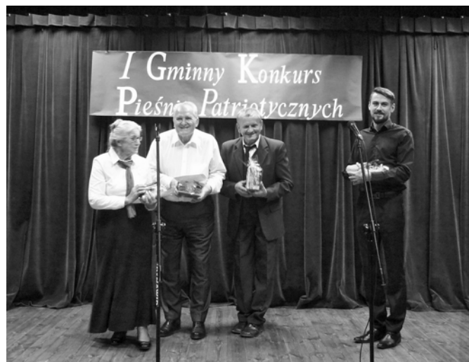
Nagrodzeni w kategorii „Dorośli”