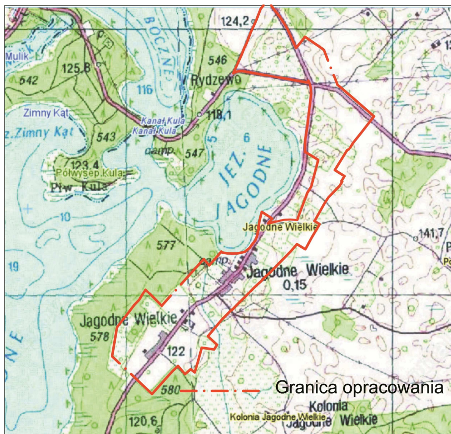
Lokalizacja terenu opracowania.

Ukształtowanie terenu jest urozmaicone. Rzędne terenu opracowania wahają się od ok. 117 do 134m n.p.m.. Przez teren opracowania przebiega droga powiatowa.