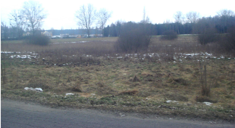
Fot. Zbiorowisko trzciny.

zaobserwowano pokrzywę zwyczajną ( Urtica dioica ), trzcinę pospolitą ( Phragmites Australis ).