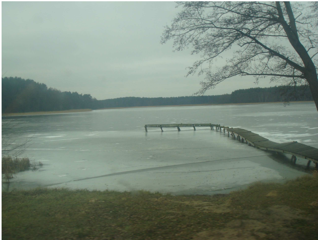
Fot. Jezioro Jagodne wraz z istniejącym pomostem.

Powierzchnia jeziora wynosi 942,7ha, głębokość maksymalna 37,4m oraz średnia 8,7m, długość maks. 8670m, szerokość maks. 1810m, długość linii brzegowej 35410m.