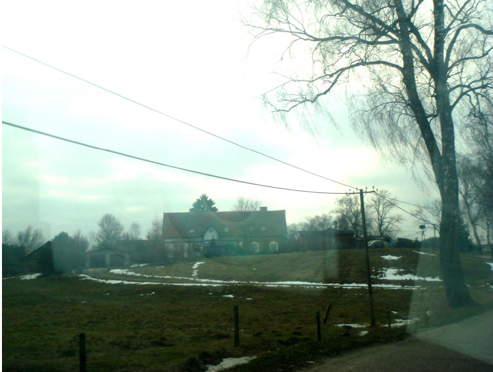
Fot. Zabudowa zagrodowa wraz z gniazdem bociana białego na słupie elektroenergetycznym.

Teren opracowania zamieszkują liczne owady: muchy, chrząszcze, dzikie pszczoły oraz motyle, mrówki, świerszcze, pasikoniki, pola uprawne bielinek rzepinek, stonka.